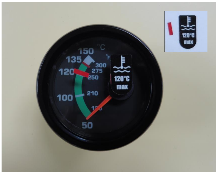
图3 - 汽缸头温度表改成冷却液温度表